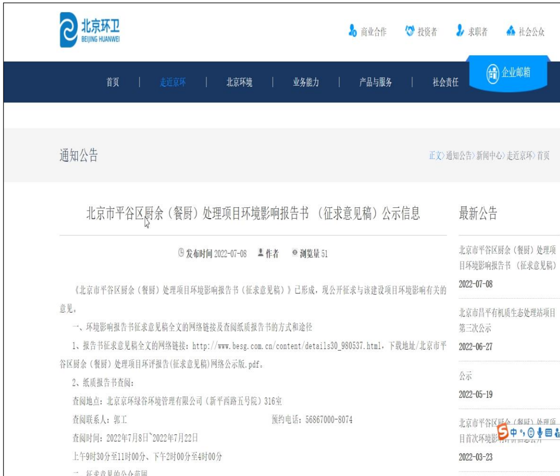
图1 首次信息公示截屏