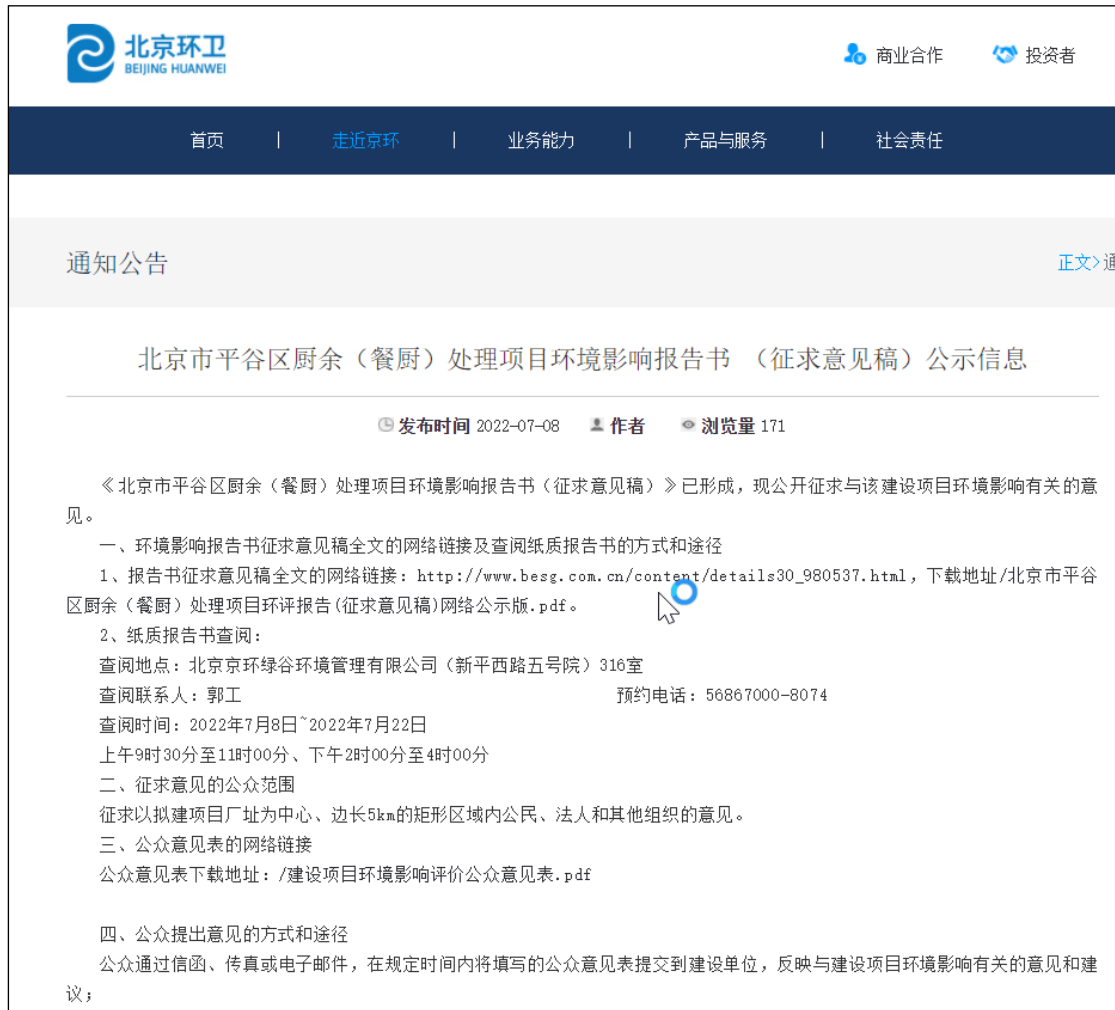
图3 征求意见稿公示截屏